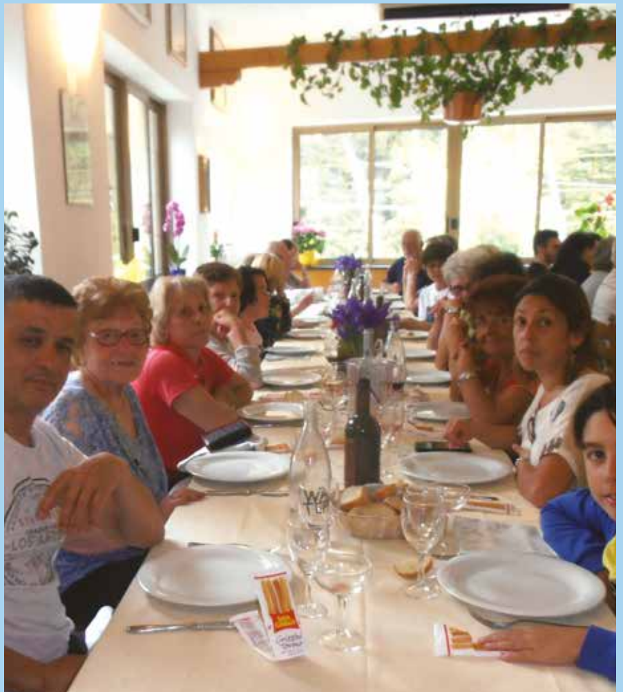
Voyage à San Remo en avril 2018