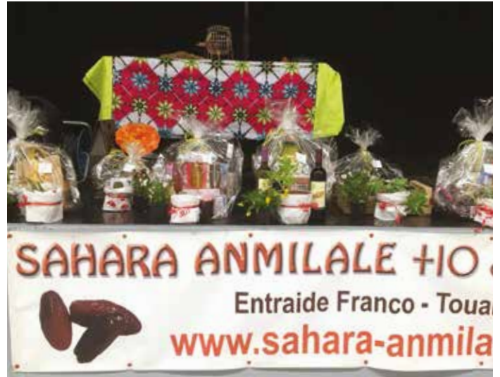
Le loto de l'association à Villecroze

N'oubliez pas, Sahara Anmilale vous invite pour son traditionnel loto de Villecroze le dimanche 11 novembre 2018 à 16h.