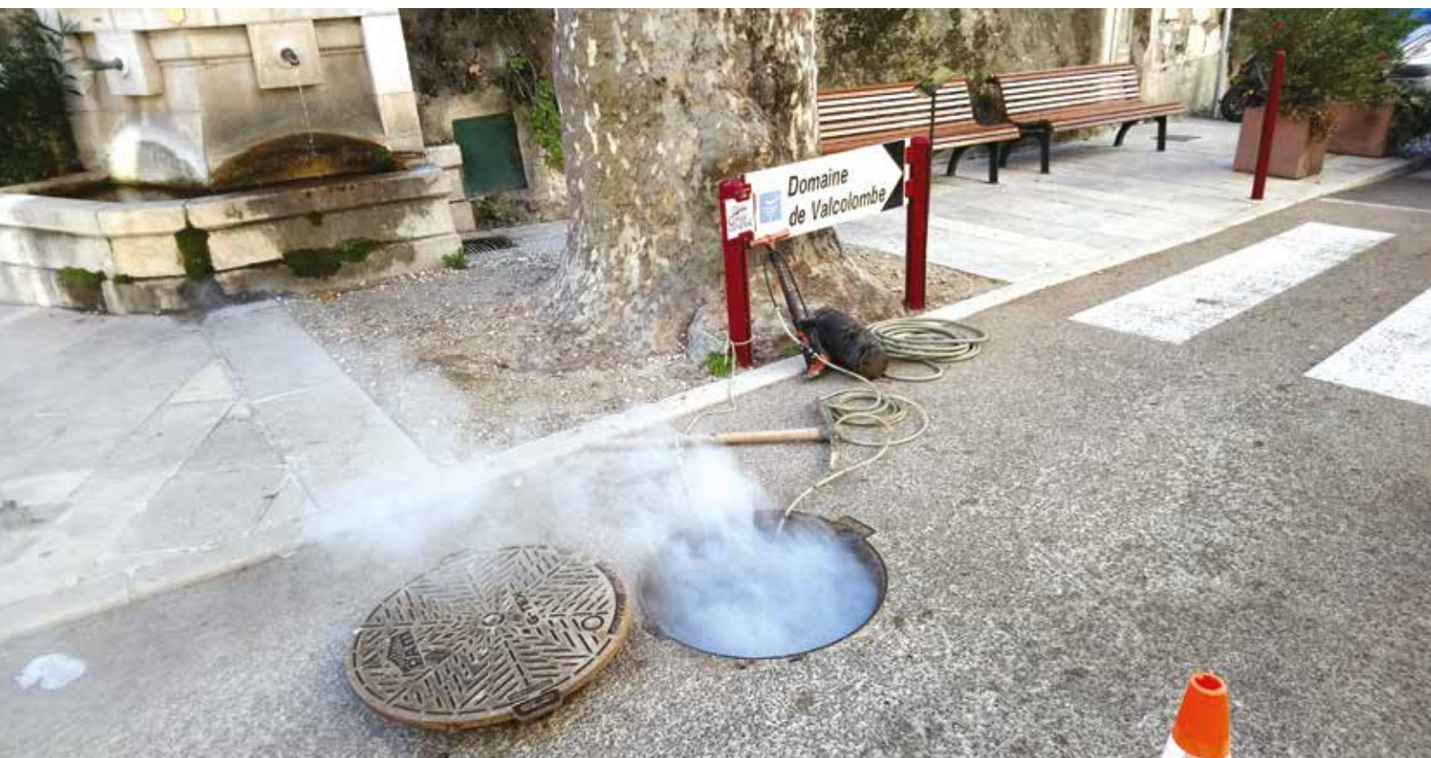
Test de fumigation en février 2018, devant la fontaine de la Marianne