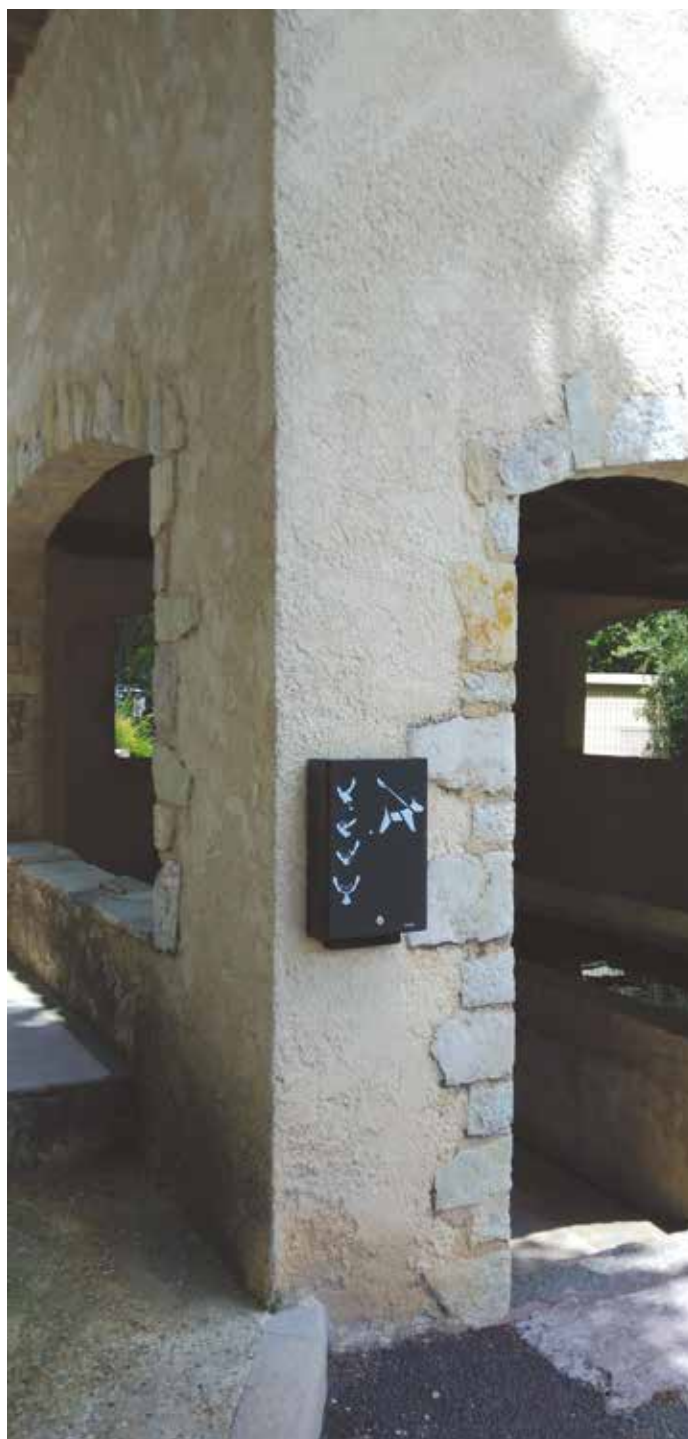
Distributeur sur le lavoir, place Général de Gaulle

Nous vous rappelons que les propriétaires de chiens sont tenus de ramasser les déjections de leur animal, que ce soit sur les chemins, les routes ou les champs du village.