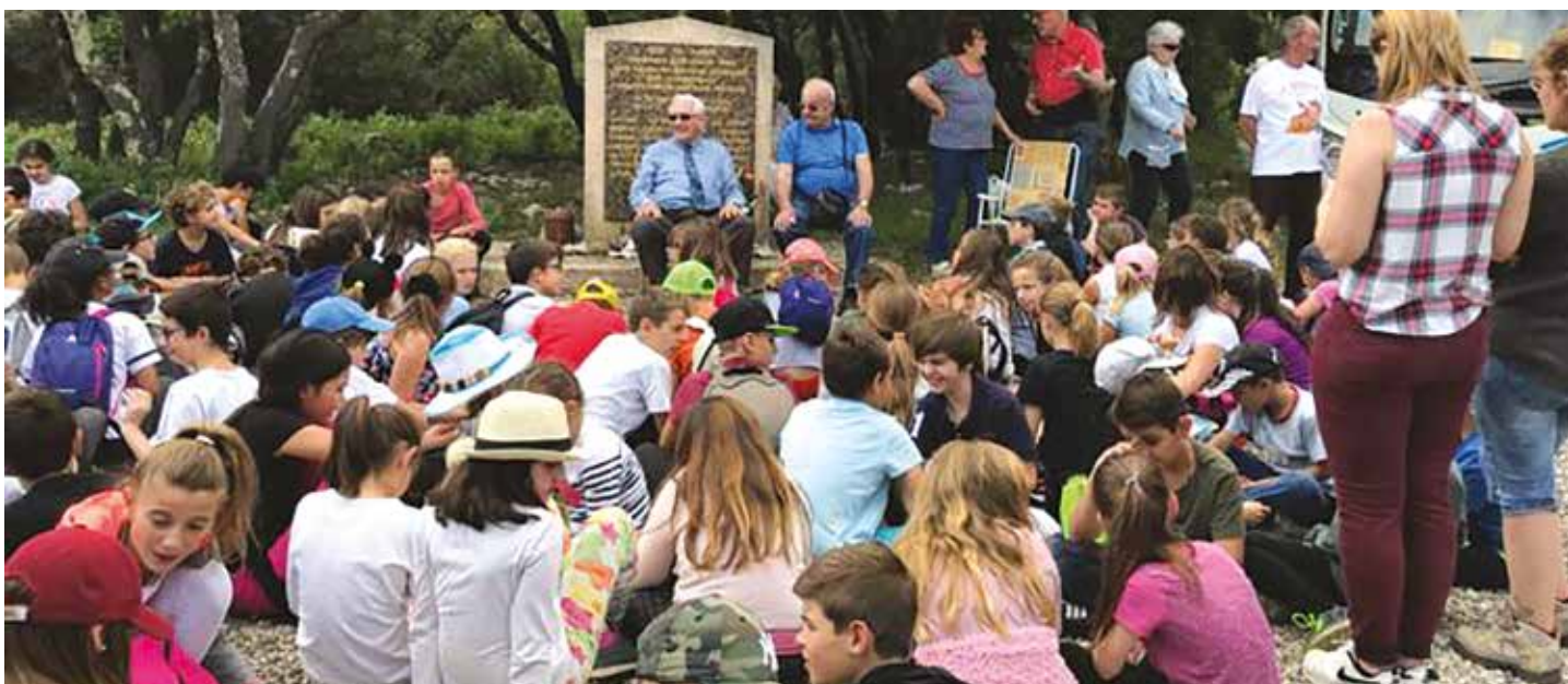
Autour d'une des stèles commémoratives du Bessillon