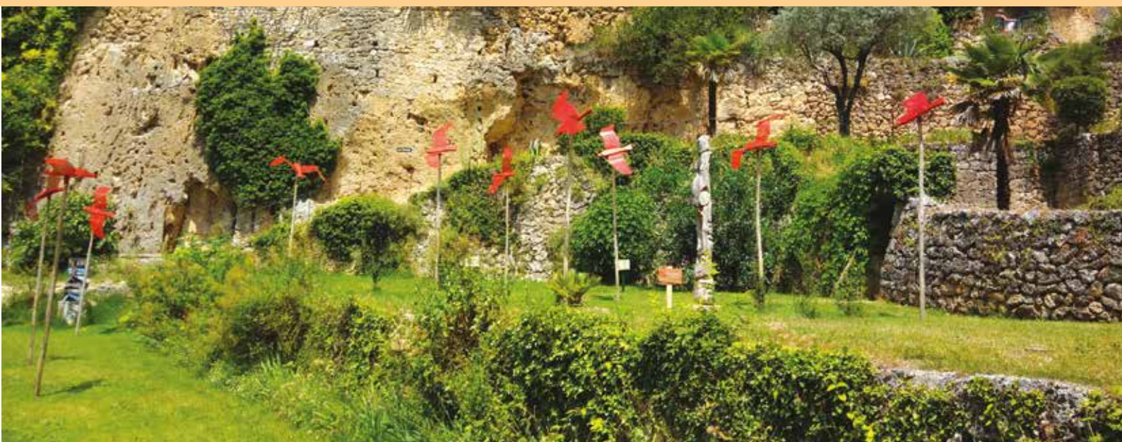
De drôles d'oiseaux ont pris leurs quartiers dans le parc. A découvrir tout l'été

La procédure, simple et rapide, concerne aussi bien les particuliers que les entreprises et les collectivités.