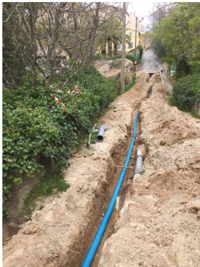
....et autour du vieux pont en avril 2018