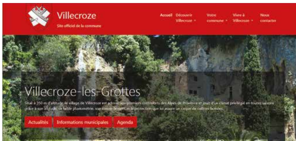
Page d'accueil du site officiel de la commune

→ Retrouvez-le à l'adresse : https://mairie-villecroze.fr/