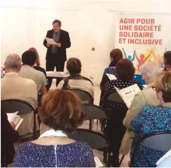
Assemblée générale et journée de travail pour les PEP 83 en avril 2018 à Villecroze