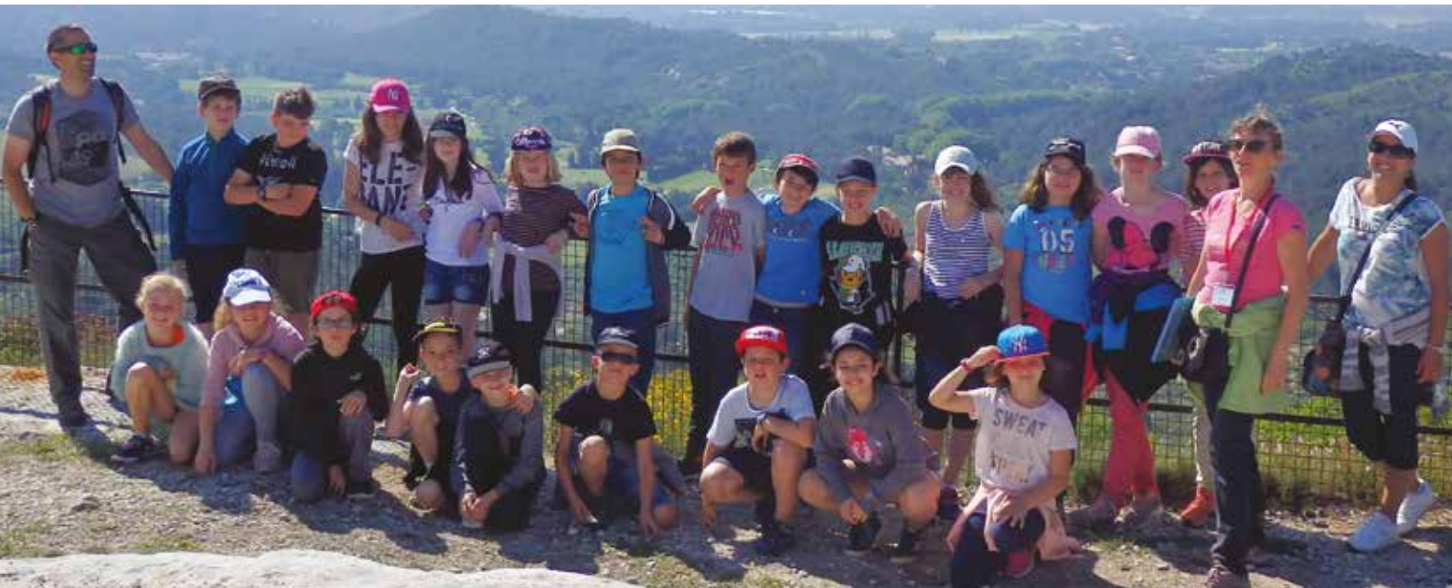
Photo de groupe au château des Baux-de-Provence