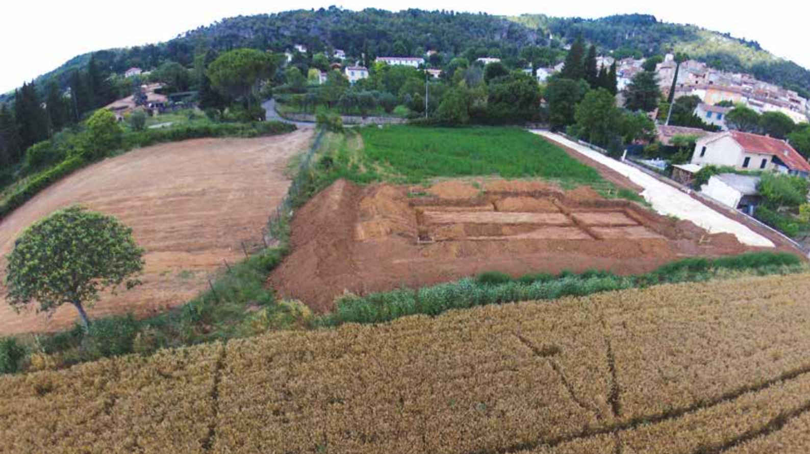
....avant leur démolition