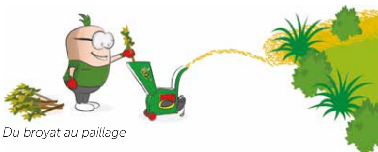
Du broyat au paillage

• Enfin, nous vous recommandons d'éviter la coupe d'arbres touchés par des parasites et d'implanter des dispositifs, par exemple des nichoirs dans les troncs laissés sur place, favorisant l'installation d'oiseaux, prédateurs de ces parasites.