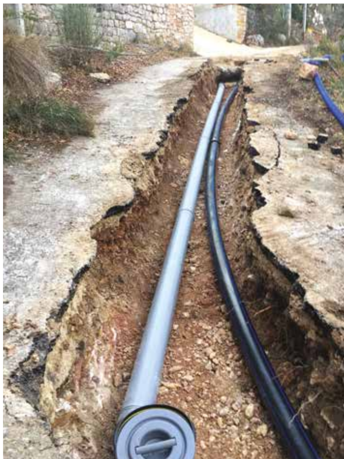
...ont été nécessaires chemin du Colombier cet hiver...

• Sur le vieux pont, situé sur l'ancienne route de Draguignan, en contrebas du pont actuel à l'entrée du village, une fuite avait été mise en évidence mais peinait à être localisée. C'est finalement l'affaissement de la chaussée sur le pont qui a permis de situer la fuite. La route a été fermée à la circulation, le temps de réaliser les travaux nécessaires, répartis entre le service de l'eau et l'entreprise de terrassement Guiol. En tout, 90 mètres de conduite d'eau ont été refaits à neuf.