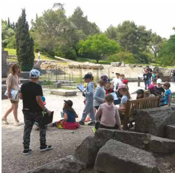
Visite et atelier sur le site de Glanum

Pour la rentrée scolaire de septembre 2018 , 143 enfants sont d'ores et déjà inscrits et de beaux projets sont sans doute en préparation.