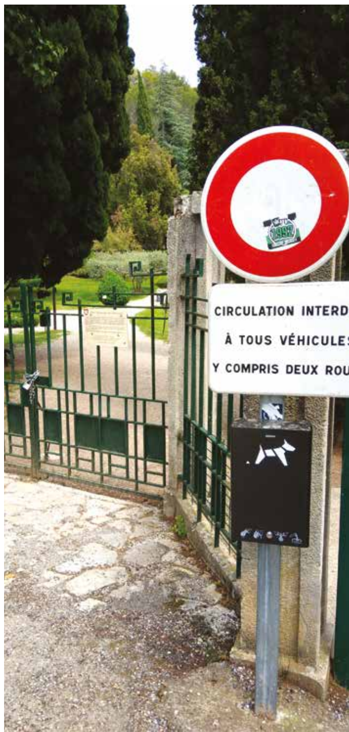
Distributeur à l'entrée du parc, côté boulevard Clémenceau

Tout contrevenant s'expose à une amende de 68 euros.