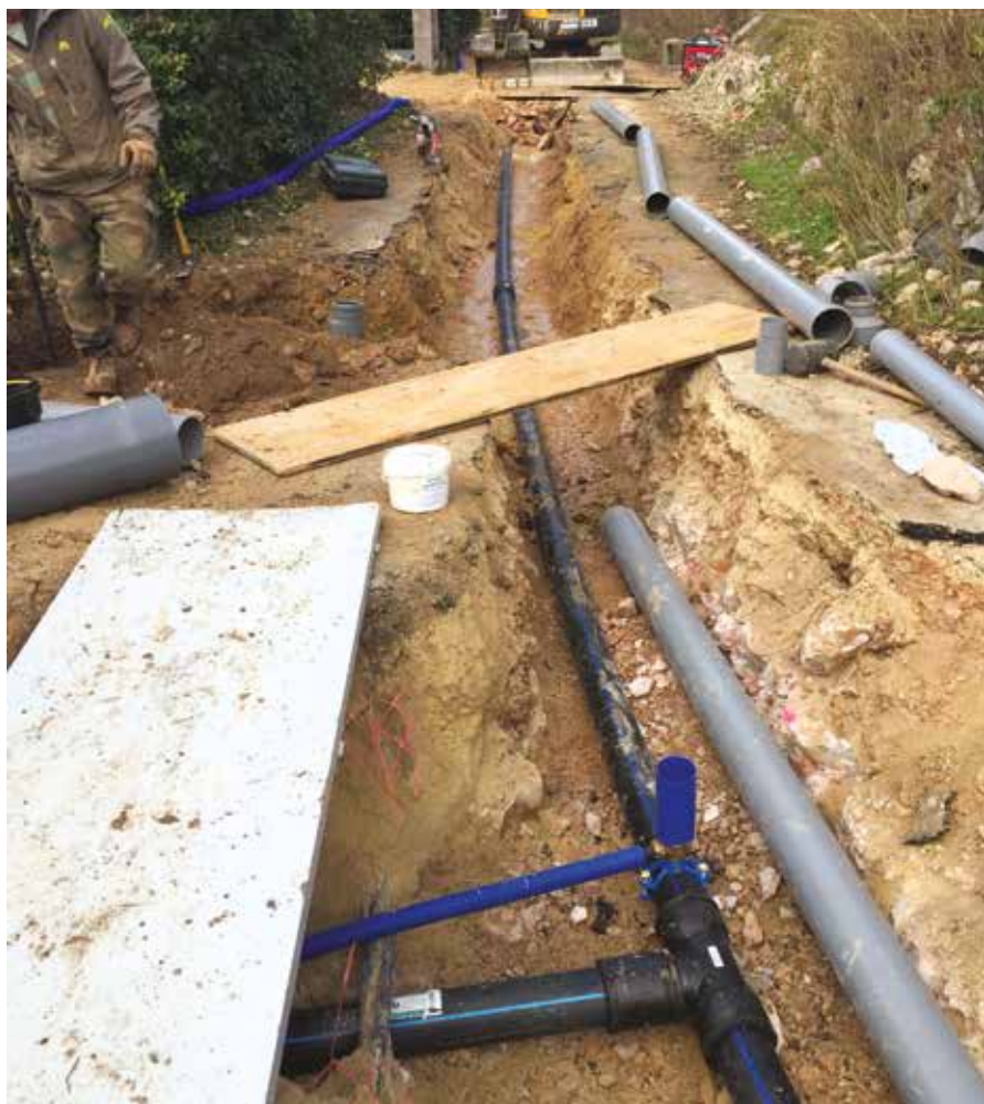
De lourds travaux...

La conjugaison de ces deux facteurs entraîne, pour 75 % des consommateurs, une baisse du montant de leurs factures d'eau potable.