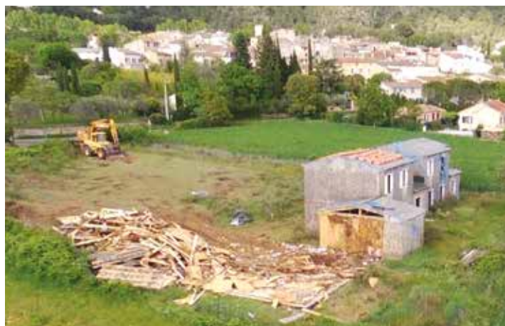
....des constructions inachevées....