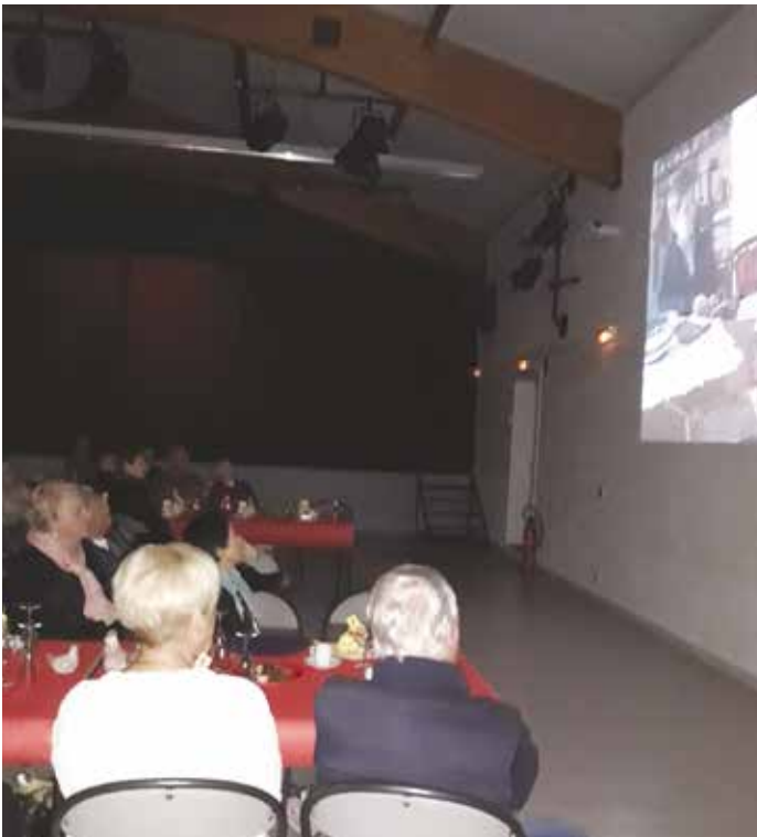
Projection devant un auditoire attentif

Dans le Var Est, avec une antenne à Draguignan, s'est mis en place un service dont le but est d'améliorer la prise en charge des personnes âgées, particulièrement lorsque celles-ci sont en risque de perte d'autonomie. Afin d'éviter les ruptures dans le parcours de santé et de favoriser dans de bonnes conditions le maintien à domicile, la coordination des professionnels de santé, par le biais d'une plateforme téléphonique dédiée, s'avère essentielle et permet, par exemple, d'améliorer le lien ville-hôpital, voire d'éviter des hospitalisations.