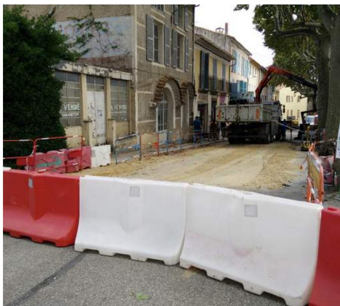
La rue Ambroise Croizat barrée pour travaux (automne 2015)