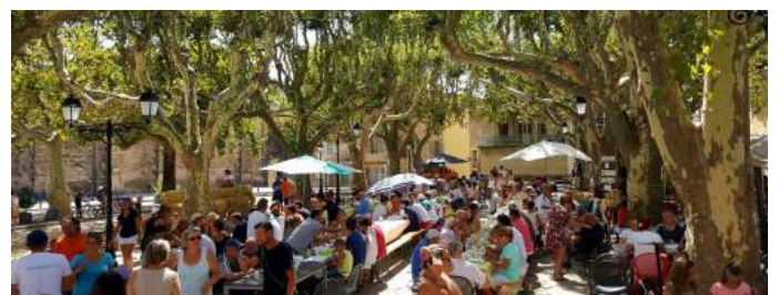
Grand Aïoli de la Saint-Romain sous les platanes (août 2017)