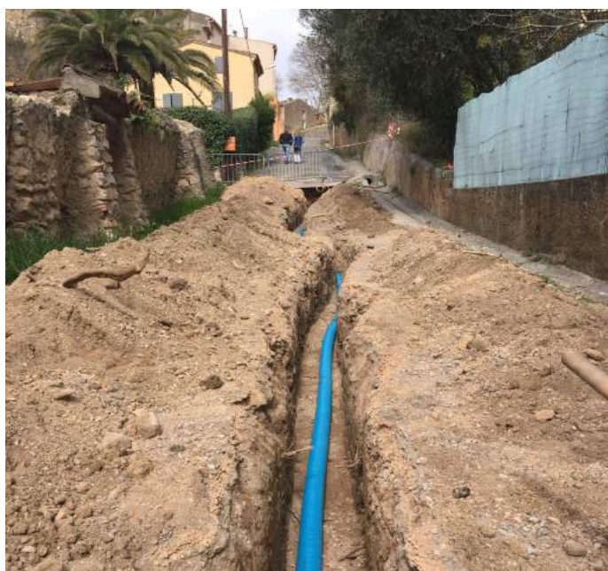
Pose d'une nouvelle conduite d'eau sur l'ancienne route de Draguignan (printemps 2018)