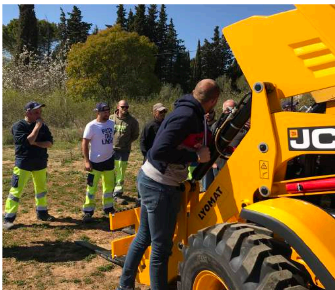
Réception du tractopelle (mars 2019)

La formation CACES de catégorie 4 concerne les engins de chantier. Organisée sur 3 jours, elle couvre les champs théorique et pratique et se conclut par un examen.