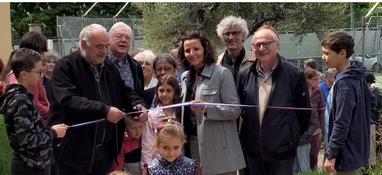
Inauguration de la bibliothèque et de son jardin de lecture le 18 mai 2019

Le 18 mai, en présence d'adhérents de tous âges et de nombreux élus, la bibliothèque a eu le plaisir d'inaugurer ses locaux et le jardin de lecture attendant.