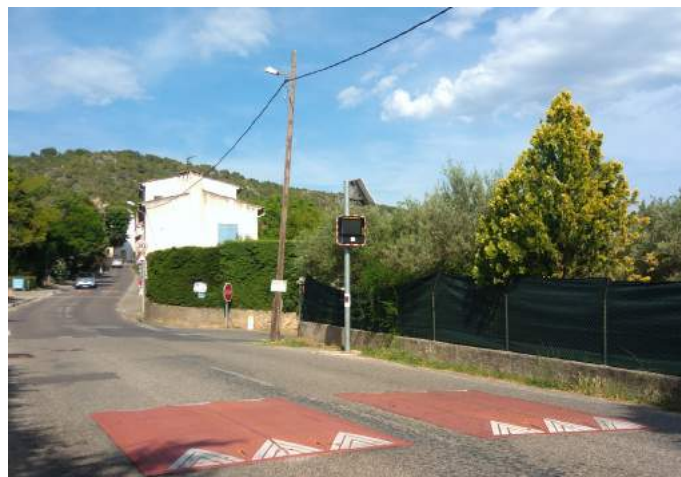
Les coussins berlinois à l'entrée du village, route de Salernes