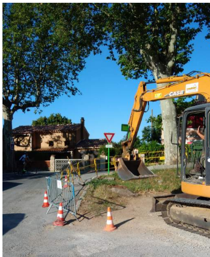
Travaux d'élargissement de l'accès au parking du Pré de Fine (juin 2019)

Cette gestion mesurée permettra de lancer des travaux indispensables pour le développement du village, comme l'aménagement du parking du pré de Fine et la sécurisation de la falaise des grottes.