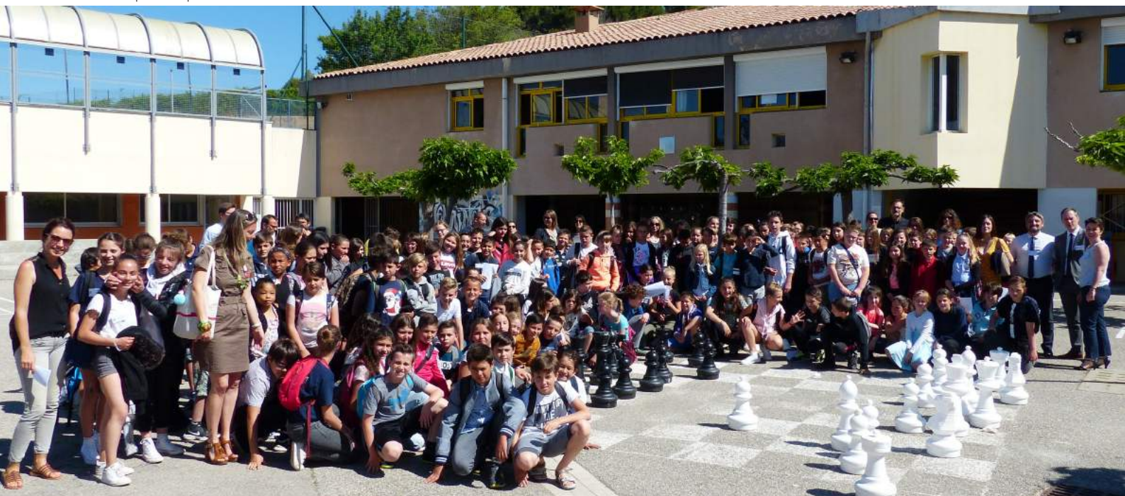
Visite du collège d'Aups le 3 juin 2019