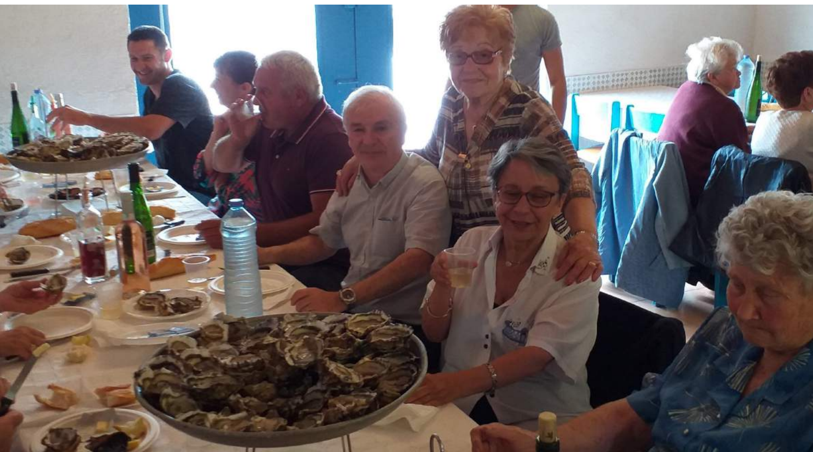
Dégustation de coquillages à Mèze