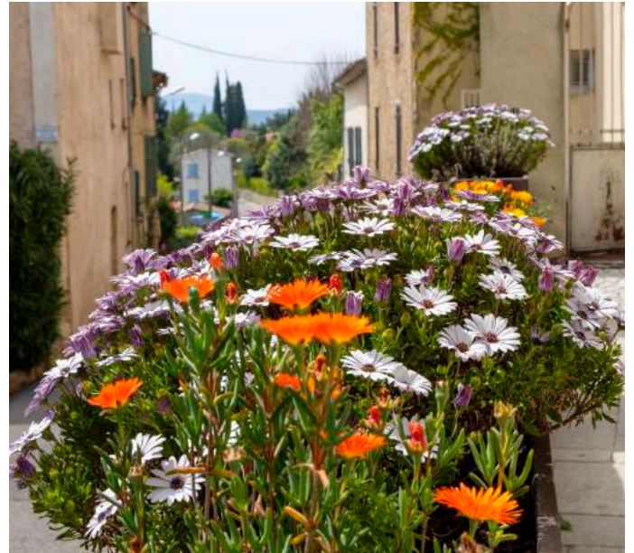
Floraison printanière sur la place de la mairie

Les Amis des Fleurs, which means The Flowerlovers, is an association which renews and takes care of the general flowery area of Villecroze.