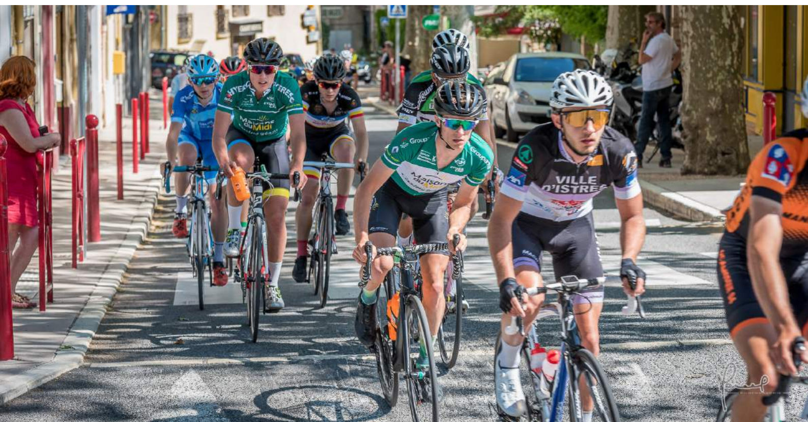
Le passage de la course au même endroit (juin 2019)