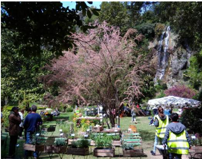
Edition 2019 de la Bourse aux Plantes

Nous vous donnons rendez-vous l'année prochaine le dernier dimanche d'avril pour une édition tout aussi réussie.