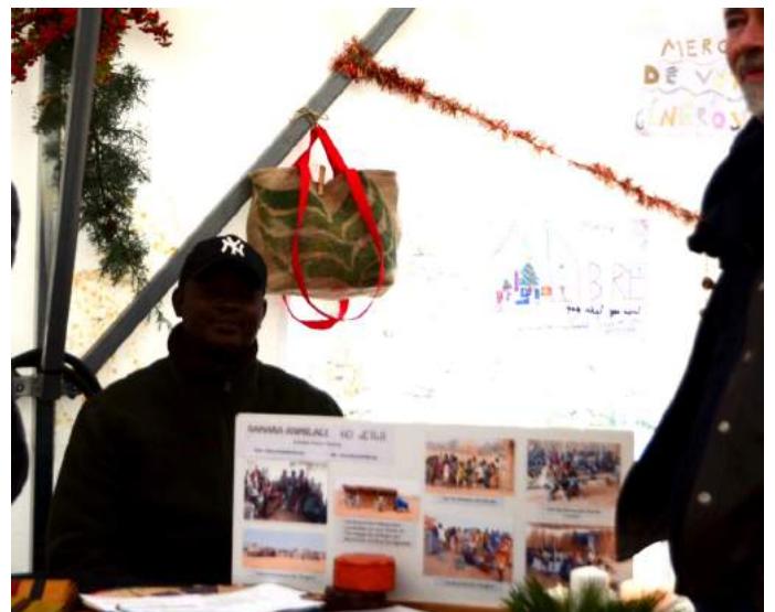
Marché de Noël à Tourtour