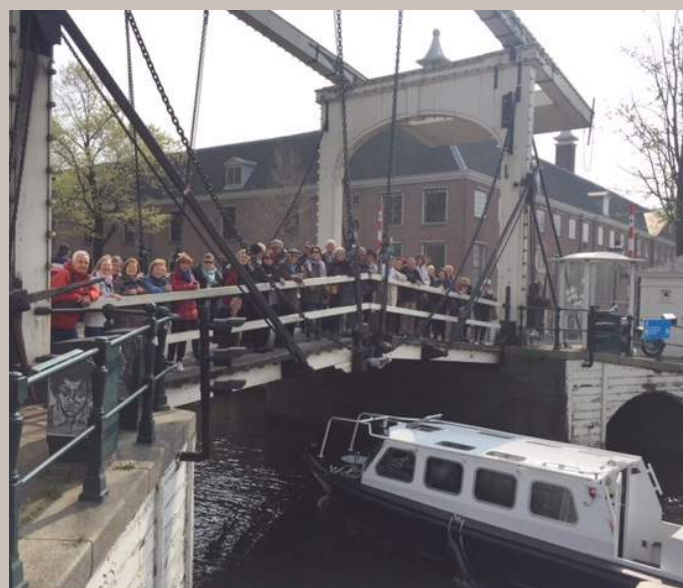
Voyage à Amsterdam (avril 2019)