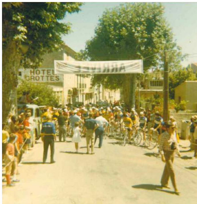
La ligne d'arrivée rue Ambroise Croizat (fin des années 1970)