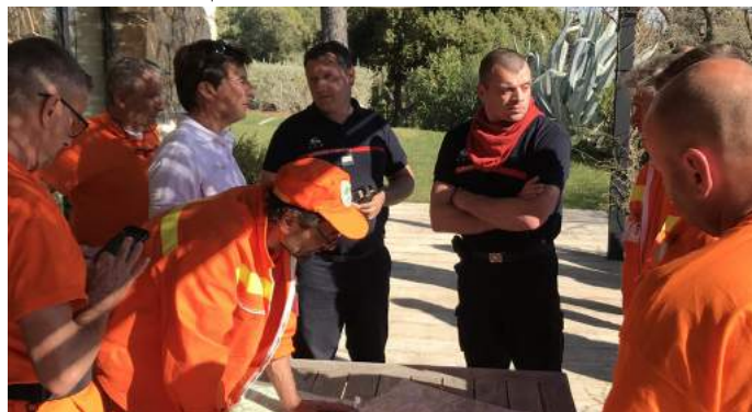
Rencontre et formation sur le terrain (mars 2019)

Un véhicule dédié aux interventions du CCFF devrait bientôt être acquis.