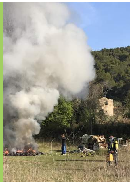
Intervention sur un feu illégal (avril 2019)

Nous vous rappelons que les contrevenants à ces réglementations s'exposent à des amendes, voire à des poursuites pénales.