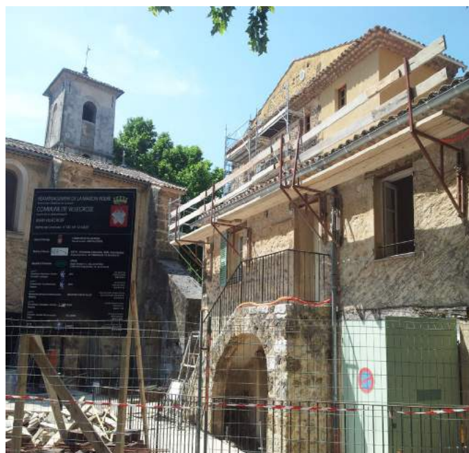
Démarrage du chantier de la Maison Roere (juin 2014)