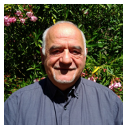
Roland Balbis maire président de la Communauté de Communes Lacs et Gorges du Verdon

L'équipe à la tête de la commune pour ce mandat 2020-2026 est composée de :